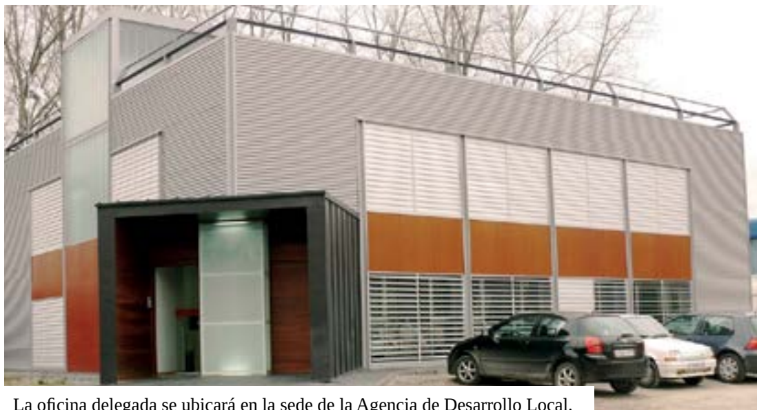
La oficina delegada se ubicará en la sede de la Agencia de Desarrollo Local.

El Gobierno de Cantabria y el Ayuntamiento de Astillero han firmado un convenio de colaboración que permite poner en marcha una oficina delegada del Servicio Cántabro de Empleo en el municipio. Se ubicará en el Centro Integrado de Formación y Empleo, que acoge entre otros servicios relacionados con este ámbito a la Agencia de Desarrollo Local. El principal objetivo de la misma es que los astillerenses no tengan que desplazarse hasta la oficina territorial de Camargo para realizar sus trámites y mejorar, así, la atención a los desempleados. En la firma, celebrada en el salón de plenos, estuvieron presentes, además del presidente de Cantabria, Ignacio Diego y el alcalde del Astillero, Carlos Cortina, la consejera de Economía, Hacienda y Empleo, Cristina Mazas, junto a la directora