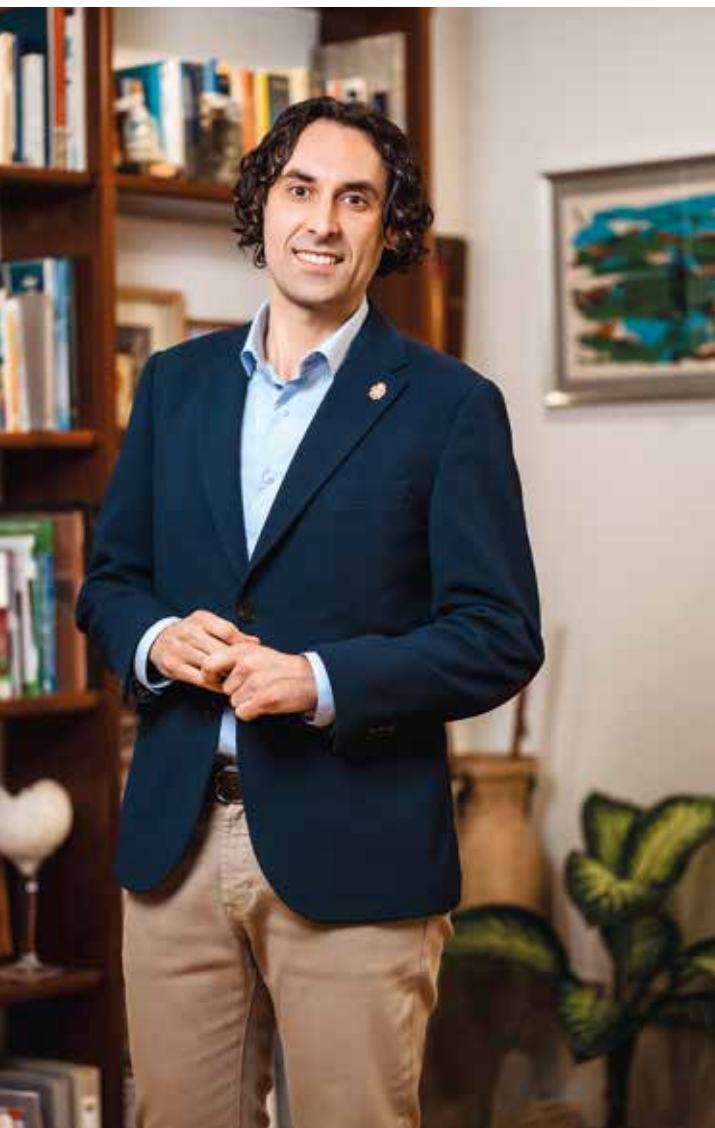
Javier Fernández Soberón Alcalde del Ayuntamiento de Astillero